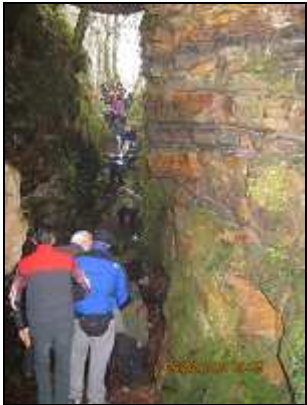
Pasando la cueva de "Jentillatxeta"