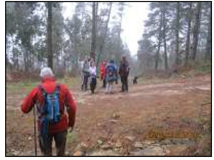
Seguimos los senderos hacia "Jentillatxeta"