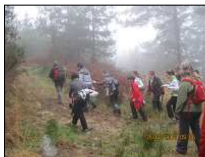
Sendero de la izquierda