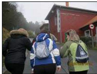
Comenzamos el paseo