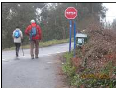
Carretera de Sollube. Arriba