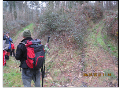
Bajamos de nuevo para subir por el sendero que va hacia "Bentazarre"