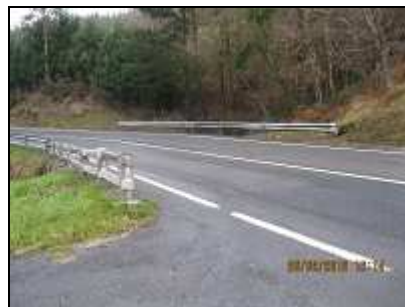
Salida a la carretera de Sollube, dirección Mañuas