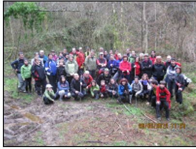
Foto del grupo