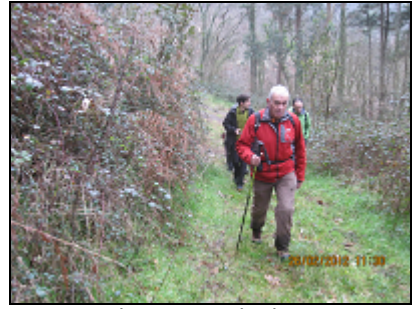
Hacia la antigua calzada