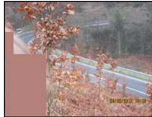
Salida a la carretera de Sollube