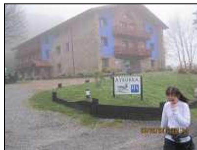
Casa rural "Atxurra"