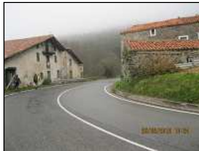
Los dos caserios de la curva y justo después giramos a la izquierda