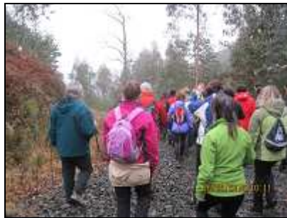
Retomamos el sendero de gravilla