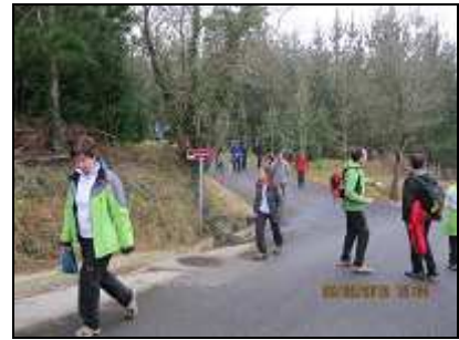
Desvío a "Bentazarre"