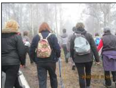
Tomamos la segunda