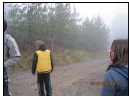
No cogemos la 1ra. pista a la derecha