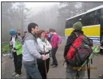
Mañuas: bajando del autobús