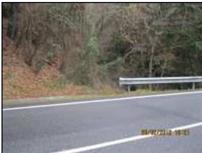
"Infernuko erreka" (pasa por debajo de la carretera)