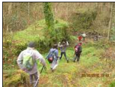
"Oiangortado zubia eta errota"