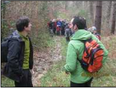
Parada en la antigua calzada