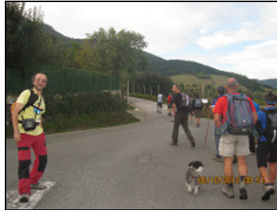
Comenzamos el recorrido