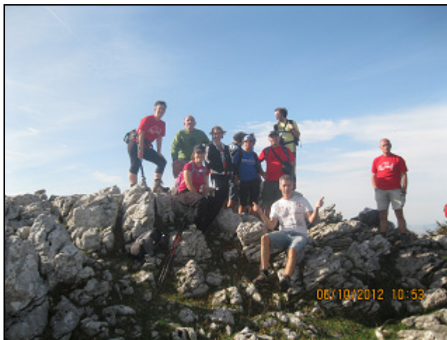
ARANGUREN (1.156 M)