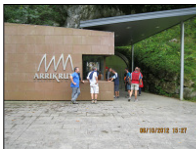
Entrada a la cueva