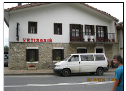
Parada en el Restaurante Urtigain