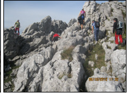
ELORRETA (1.146 m)