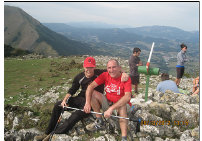
ORKATZATEGI (874 m)