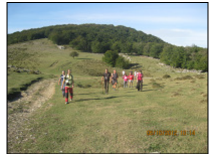
Collado entre Elorreta y Aranguren