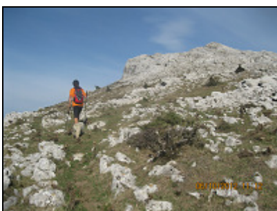
Subiendo al Elorreta