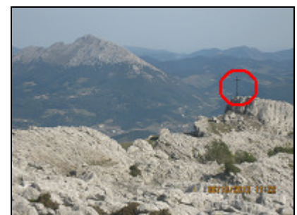
El Kurutzeberri y al fondo el Udalaiz